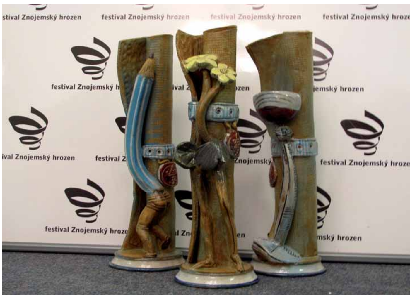
Autorem těchto cen je Zdeněk Maixner