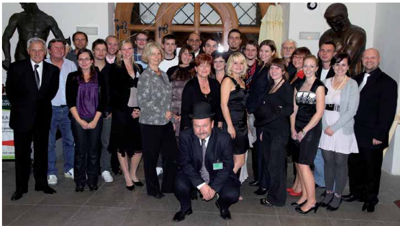
Realizační tým festivalu ZH 2010