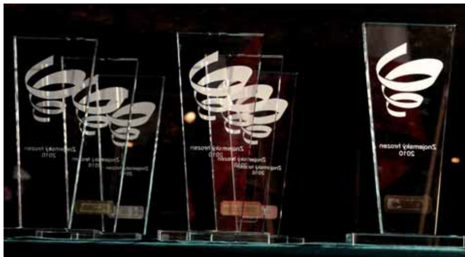
Autorem cen je sklář Martin Cvrček.